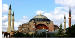
Turistler en çok Ayasofya'yı ziyaret etti