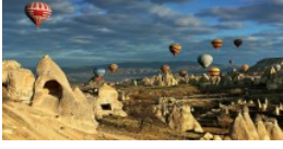
Turizm sektörü 2016'ya hazır