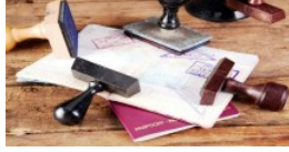
6,3 milyondan fazla Türkiye vizesi alındı