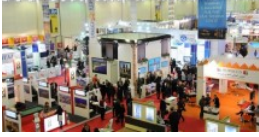
Tatil tutkunları EMITT'te buluşacak